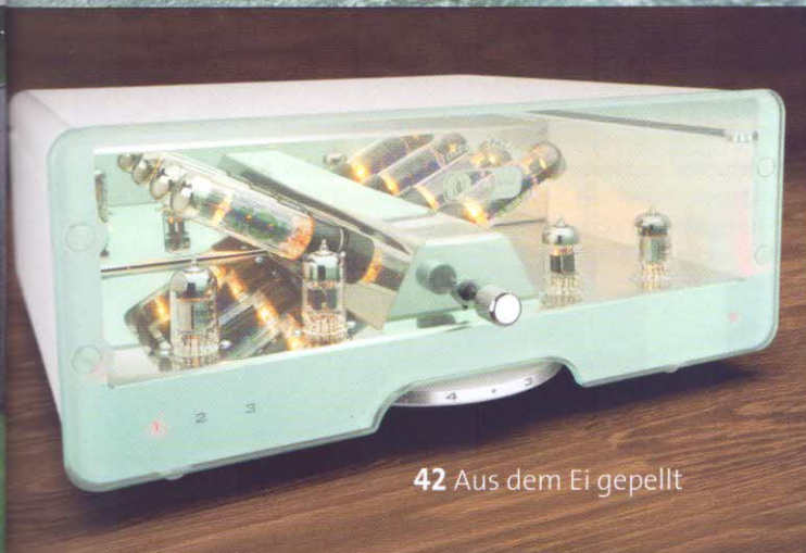
42 Aus dem Ei gepellt