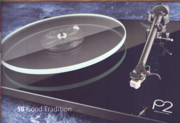
58 Good Tradition