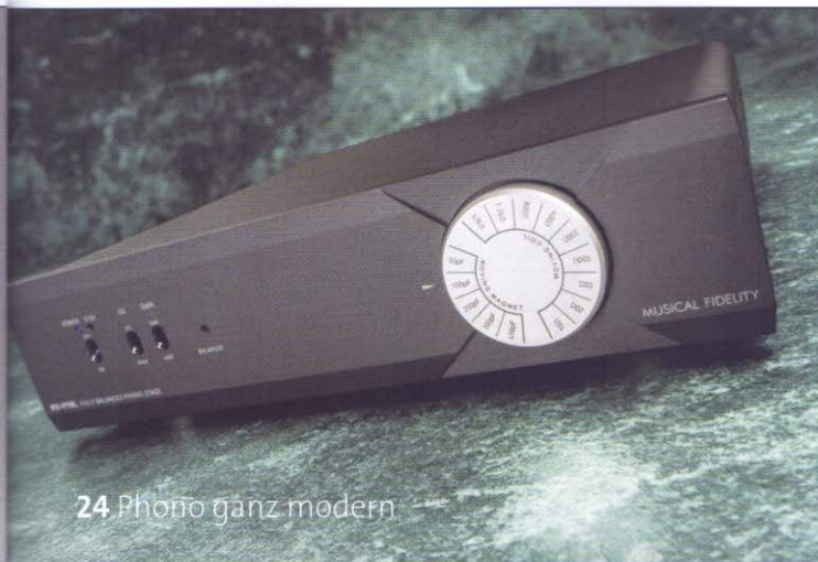
24 Phono ganz modern