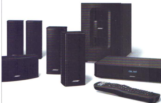
Bose Cinemate 520