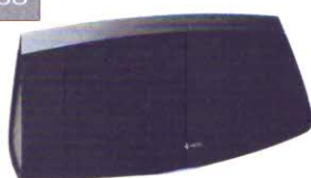
Denon Heos 7