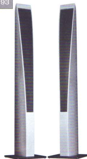
Revox Scala 120