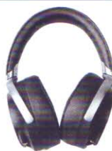
Sony MDR Z7