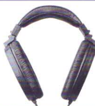
Koss ESP 950