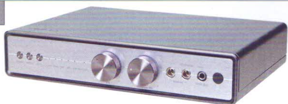
Asus Essence 3