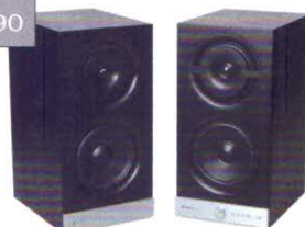
Raumfeld Stereo M